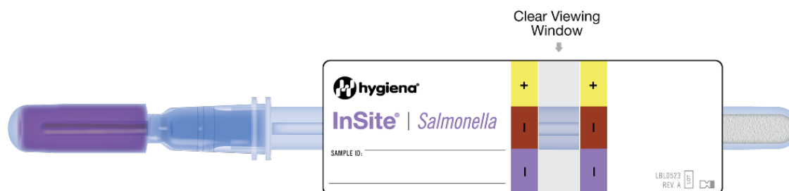
Results in the Viewing Window of the InSite Device (This diagram shows the label laid out flat.)